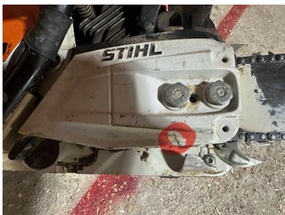
【クラッチカバーの亀裂】