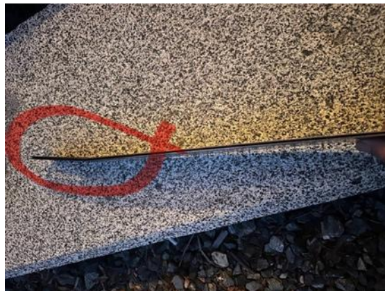
【ガイドバーの曲がり】