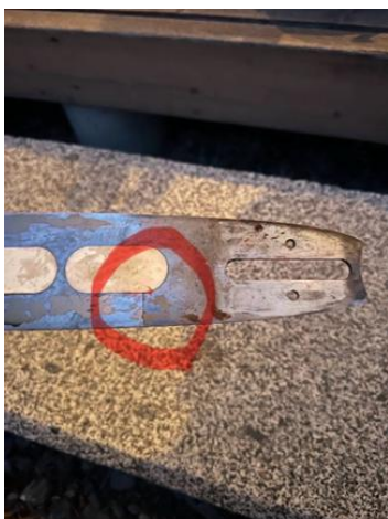
【ガイドバーの亀裂】