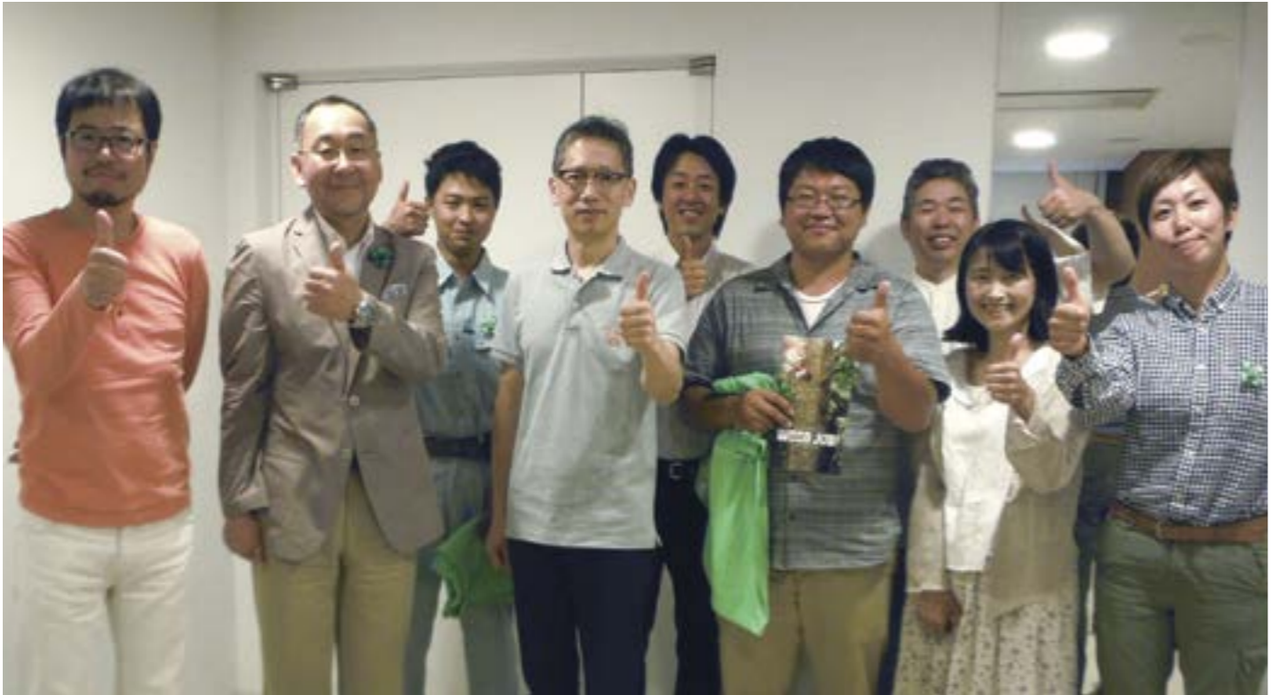
全国林業後継者大会の楽屋にて、出演者とスタッフによる記念写真 (2014年5月31日撮影)