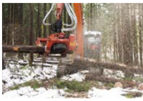
プロセッサ【枝払い・玉切り・集積】 作業道や土場などで、枝払い、玉切り、玉切りした材の集積作業を行う機械。

チェーンソーや集材機等の従来の機械に比べて、作業効率や労働強度等の面で優れた性能をもつ林業機械。主な高性能林業機械は、スキッド、タワーヤード、スイングヤーダ、フェラーバンチャ、プロセッサ、フォワーダ、ハーベスタなどがあ。高性能林業機械の導入は、生産性の向上による低コスト化に加えて、労働環境の改善、労働災害の防止等にも寄与するため、全国で導入が進められている。