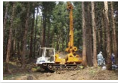
タワーヤード【架線集材】 簡易に設置できる人工支柱を装備した自走式集材機。作業路を入れられない急傾斜地での集材作業に向いている。