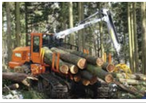
フォワーダ【集材】 グラップルで材を荷台に積んで運搬する集材専用の機械。主として土場からトラックまでの作業路を運搬する。