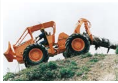
スキッド【集材】 丸太の端をつかんで土場まで地引集材する機械。主伐等により伐開された林地内で使用される。