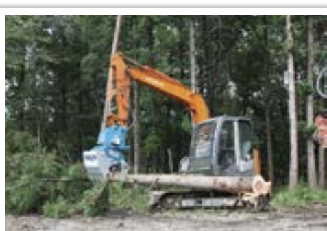
その他 高性能林業機械 従来の高性能林業機械には含まれない、新たに開発された機械。写真は「グラップルバケット」(掘削・集積)。