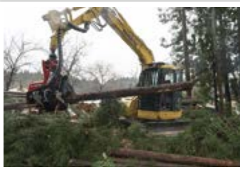
ハーベスタ【伐倒・枝払い・玉切り・集積】 立木の伐倒、枝払い、玉切り、玉切りした材の集積作業まで一貫して行う機械。平坦な林地での皆伐作業に向いている。