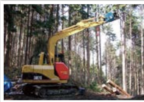
スイングヤーダ【簡易架線集材】 ショベルカーのアームを集材用ウインチのboom式タワーとして使用する、主索を用いない簡易型架線集材機。